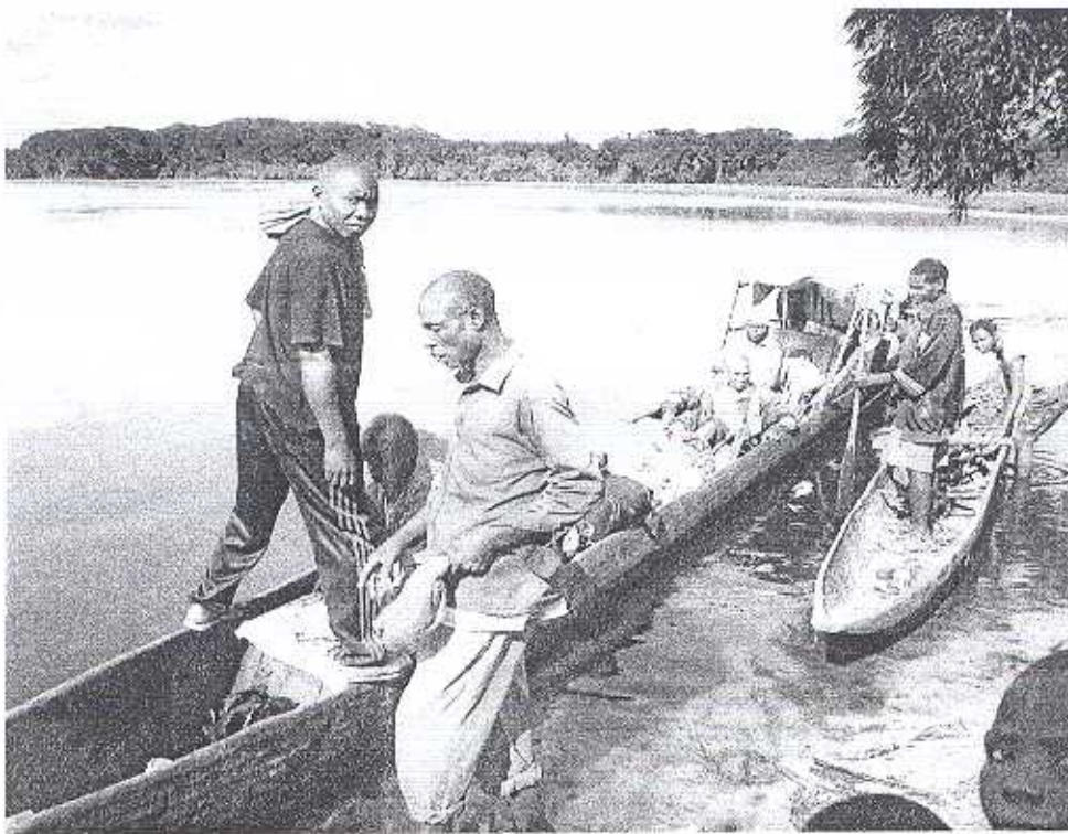
Gut, dass es den Tshuapa-Fluss gibt.....

alle Aktivitäten. Erst nach zwei Stunden haben wir Hoffnung abzufliegen. Es kommt anders. Der Flugleiter erklärt uns, dass der Pilot krank sei und eine andere Maschine bis Mbandaka fliegen wird. Am Nachmittag fliegen wir endlich ab. Dort angekommen sagte man uns, wir müssten übernachten, heute käme kein Flugzeug mehr, - aber morgen. Gut, dass in Mbandaka unsere belgischen Mitbrüder eine Missionsstation haben. Dort bin ich herzlich willkommen und verbringe zwei Tage am Äquator, am Ufer des Kongostromes. Dann ruft jemand an: morgen um 8 Uhr alle Passagiere zum Flugplatz kommen. Der Abflug mit einer kleinen Antonov-Maschine ist erst um 11 Uhr. Bis Boende sind es 500 km. Nach 1 ½ Stunden sehe ich unter mir die Stadt Boende. Auf der kurzen Fluggpiste laden wir unser Gepäck aus: Koffer, Kisten und Kartons. Einige Sachen konnte ich wegen Gewichtsbeschränkung nicht mitnehmen. Morgen soll ein Flugzeug kommen. Das dauert aber vier Tage. Inzwischen beziehe ich bei Pater Oskar mein Quartier.